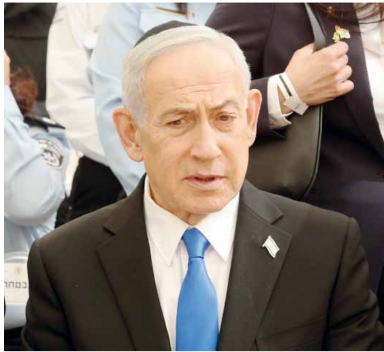
Defensa de la humanidad. El primer ministro dijo que es el rol de Israel ante "el fanatismo bárbaro".