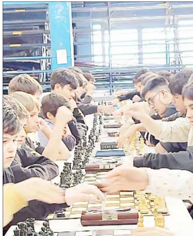
Aspecto del torneo jugado el domingo, en el Complejo República de Venezuela.