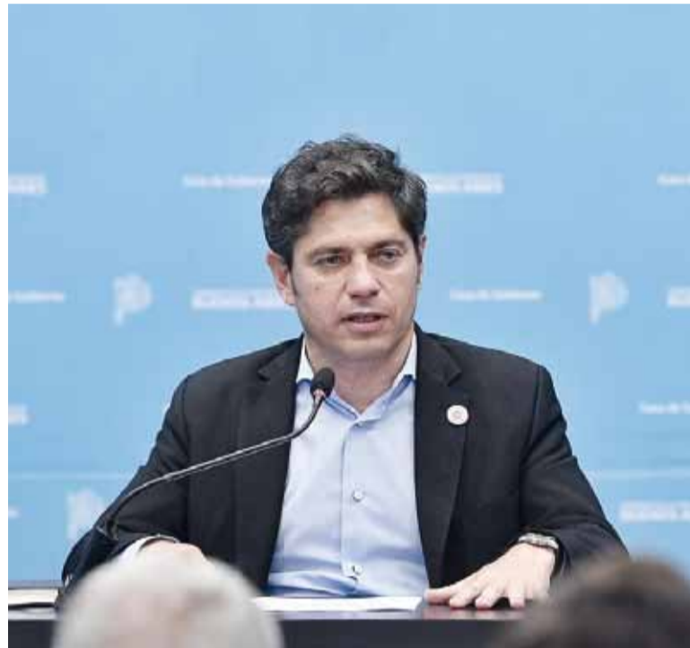
En la mesa. El gobernador Kicillof encabezará hoy la reunión en la Corte.

En la primera audiencia, Anses argumentó que no contaba con información suficiente para calcular las transferencias adeu-