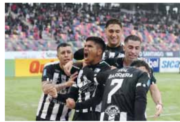
Tarde de goles en Santiago.

El Pirata se ubica quinto con 23 puntos, a falta de dos fechas, mientras que el Guapo suma 20 y se mantiene expectante en la pelea por ingresar a la próxima instancia.