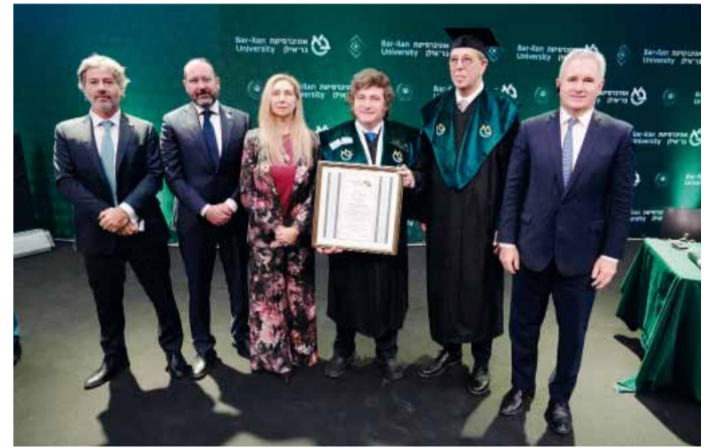
Honoris Causa. Milei y comitiva, ayer en la Universidad de Bar-Ilan.

bienvenido a Jerusalén, mi amigo, Presidente de Argentina Javier Milei, un gran amigo del Estado de Israel. Israel y Argentina están juntas, más fuertes que nunca". El encuentro entre ambos líderes se produjo en un contexto internacional complejo, marcado por tensiones en Medio Oriente y el conflicto con Irán, donde Argen-