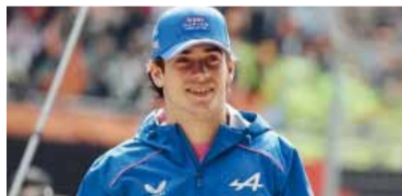
Saldrá a pista desde las 12.45.

El pilarense recorrerá el trazado en uno de los micros descapotables dispuestos por la Ciudad, en un contacto directo con los fanáticos que se acerquen al lugar, además de la entrega de remeras como parte del espectáculo. La exhibición contará con