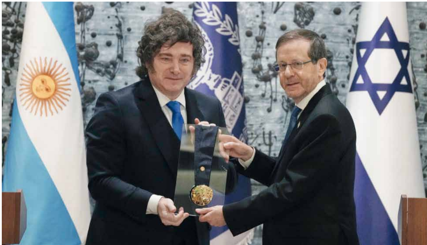
Tras ser distinguido, el líder libertario ratificó el traslado de la embajada argentina a Jerusalén.

billones. El litigio se centra en la suspensión de transferencias de ANSES dispuesta por el DNU 280/2024 del gobierno de Javier Milei. En La Plata esperan una medida cautelar que reactive los envíos de fondos. Página 2