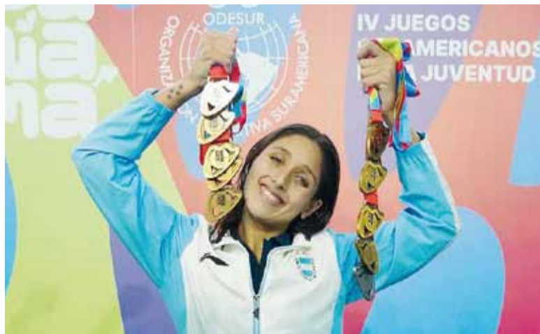
Superioridad. Agostina estableció un nuevo techo competitivo.

La campanense no solo fue la máxima ganadora del certamen, sino que estableció un nuevo techo competitivo al superar marcas previas de consagración en una misma edición. Su dominio se expresó tan-