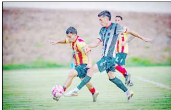
Bull Dog cayó en su visita a Estudiantes.

Entre el viernes y el domingo pasado se disputó la octava fecha del torneo Interligas, competencia